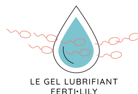
LE GEL LUBRIFIANT FERTI·LILY